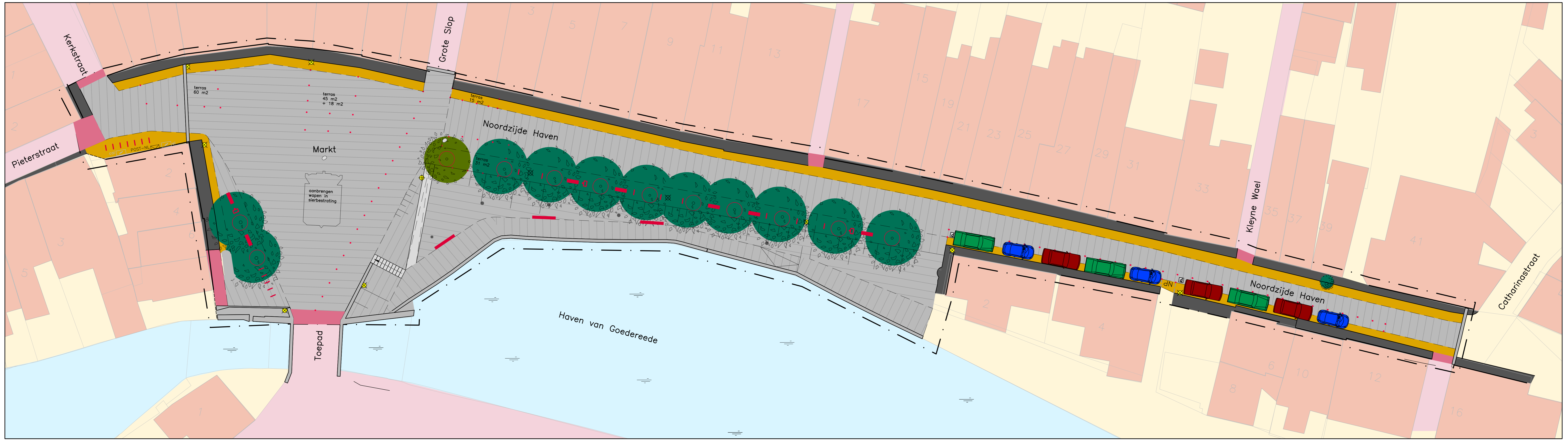
Ontwerpvariant gedeeltelijk parkeren Noordzijde Haven