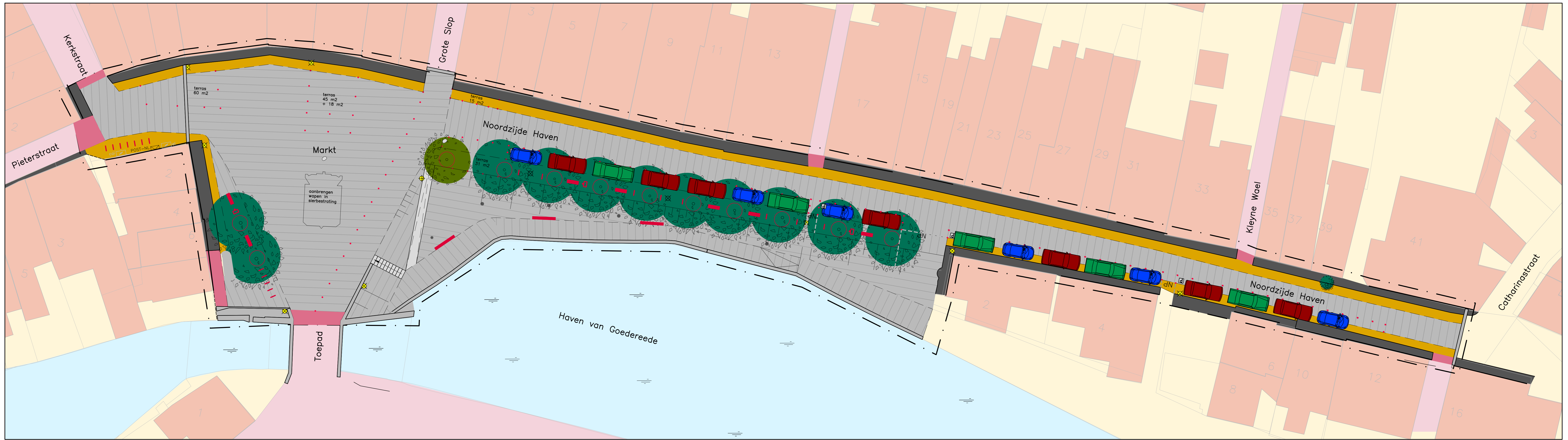
Ontwerpvariant geheel parkeren Noordzijde Haven

- alle hoogten in meters t.o.v. N.A.P. tenzij anders is vermeld - alle maten in meters tenzij anders is vermeld